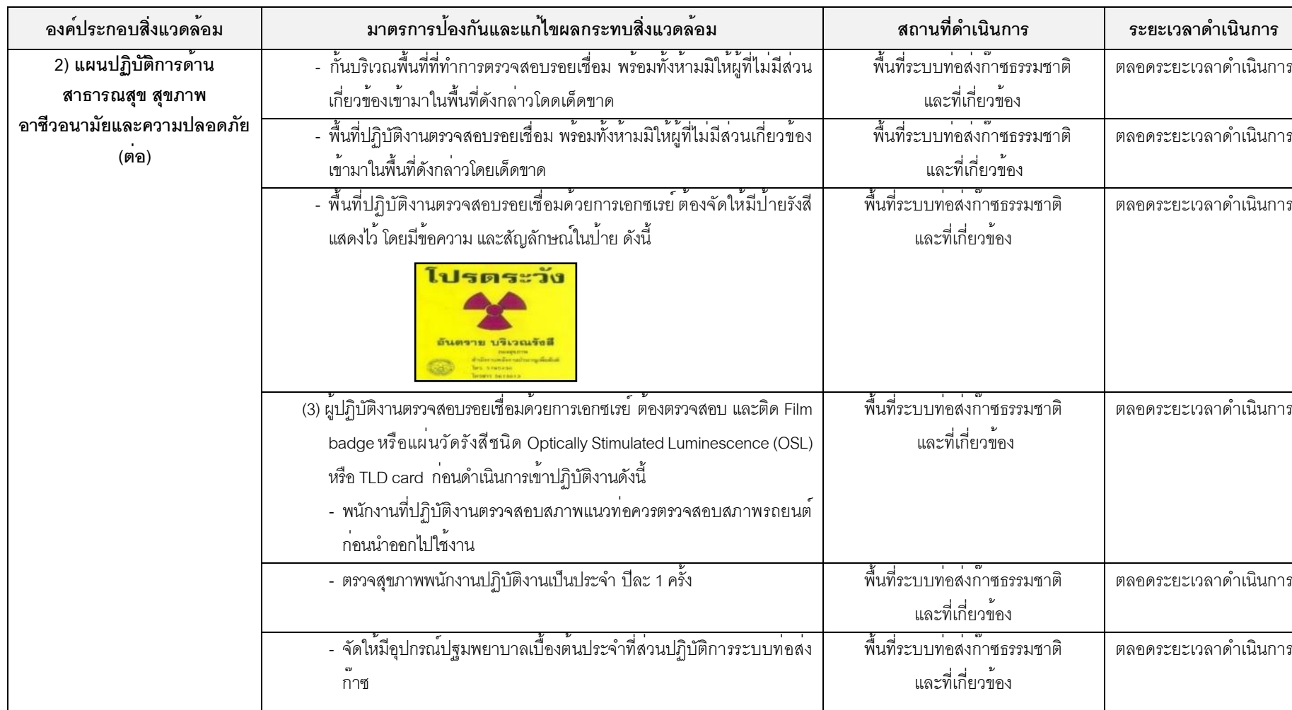
ตารางที่ 1.4-1-3 (ต่อ)